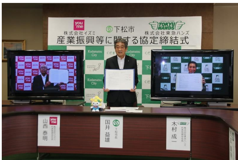
写真:2021年9月24日、締結式の様子