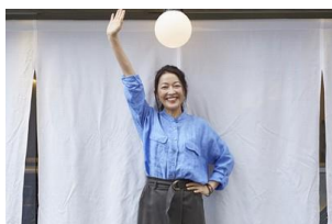
羽田基商店 (イメージ)

下関の味といえば「コレ」や日常使いやおもてなしにお使いいただける「コレ」をセレクトしました。下関・関門の良いもの山口県在住の作家さんの商品などを展開いたします。