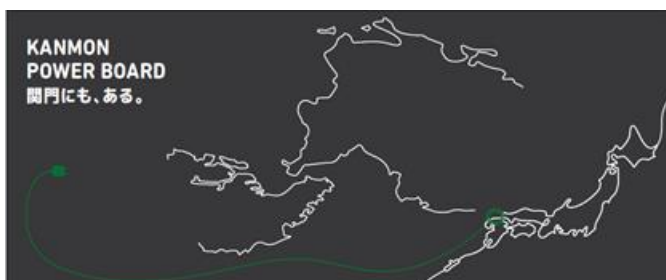
※KANMON POWER BOARD (イメージ)

「プラグス マーケット下関店」では、下関観光コンベンション協会をはじめ、マチウェブマガジン「テンセンジン」等に協力いただき、最新のマチ情報を発信してまいります。