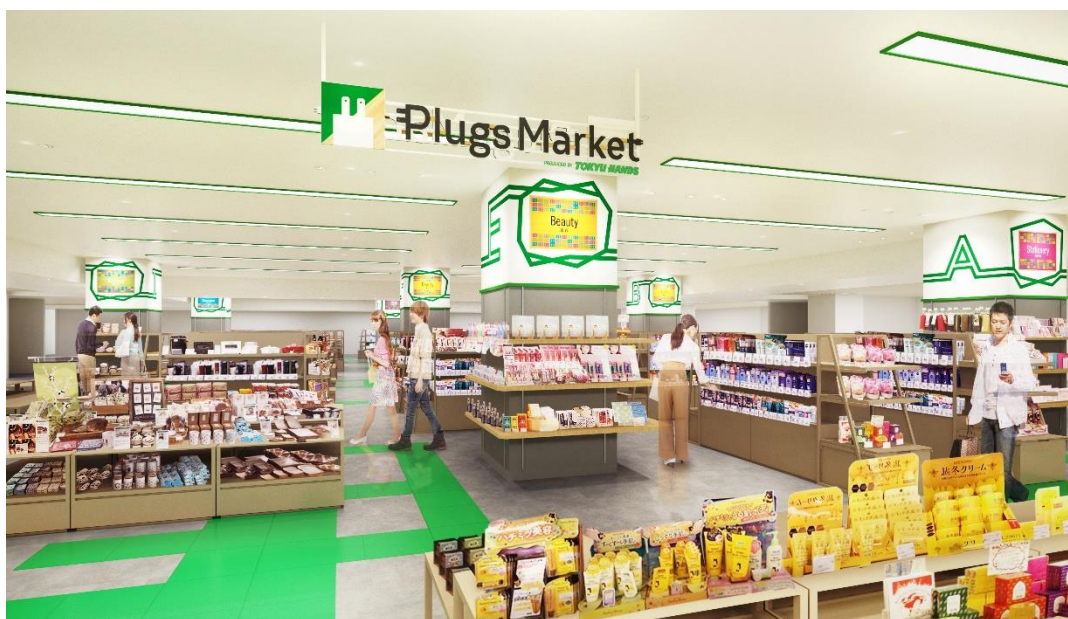
プラグス マーケット下関店 イメージ

株式会社東急ハンズ(本社:東京都新宿区、代表取締役社長:木村 成一)は、地域密着型の百貨店との協業で地方再発見・地域共創に取り組み、地方および郊外における新たなマーケット創造を目指す新業態「プラグス マーケット(Plugs Market)」を2020年早春からスタートさせますが、このたび、大丸下関店とのコラボレーションによる第2号店「プラグス マーケット下関店」の開業日とフロア構成の概要が決まりましたのでお知らせいたします。