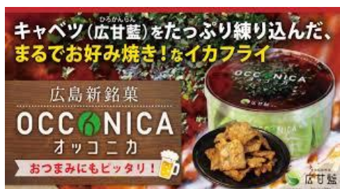
広島のスウルフード