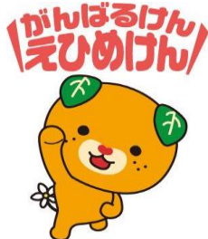
愛媛県イメージアップキャラクター「みきゃん」

・開催日時：9月22日(土)～9月24日(月・祝) 13:00～13:30 / 15:00～15:30