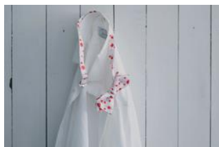
新発売の蝶ネクタイ