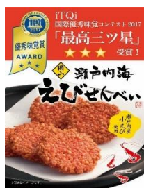
世界に認められた岡山の味