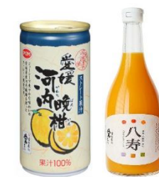
愛媛のみかんジュース