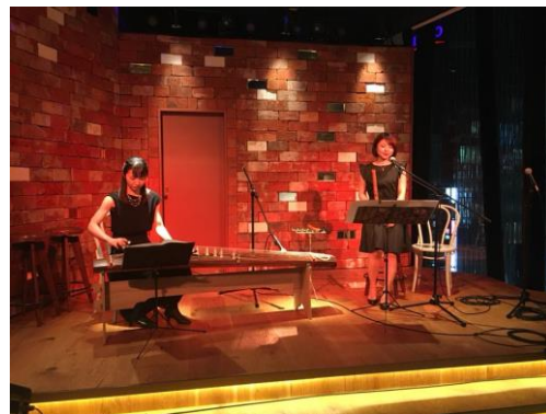
銀座和楽器カフェライブ イメージ