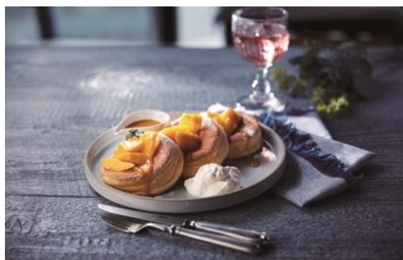
人気メニューのパンケーキ