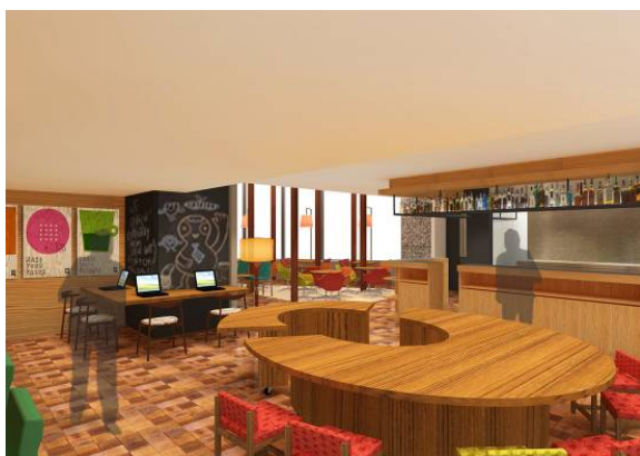
SHAKE COUNTER (シェイクカウンター)

実演販売にワークショップ、 ハンズにちりばめられたあらゆるヒントを シェイクして体験できるカウンター。