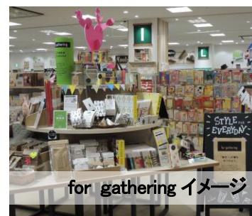
for gathering イメージ

「身の回りスタイルを見つけよう」をテーマに、こだわりのあるステーションナリーとパーソナルスタイル小物を組み合わせ、使用するシーンに合わせてお選びいただけるご提案。