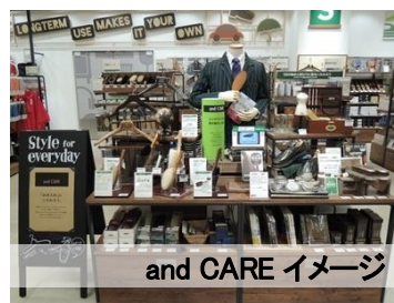
and CARE イメージ