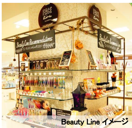
Beauty Line イメージ

BeautyLine(ビューティライン)では、女性が美しくあるために必要なものを「素材」と考え、コスメから、メイク道具、ケア用品まで幅広く取り揃えました。女性の身体を美しくし、気分を盛り上げる素材にあふれた場所として、お役に立てるコーナー作りを心がけてまいります。