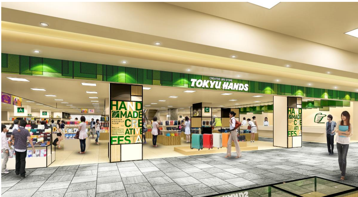
東急ハンズ金沢店 イメージ

北陸エリア初出店となる金沢店では「金沢いつモノ全集」をストアコンセプトに、日々の暮らしを彩る金沢のいいモノ、金沢と北陸が育んできたいいモノを東急ハンズの視点で編集し展開いたします。また東急ハンズで人気の商品や、話題の商品も展開し、地元のお客さまはもちろん、観光で訪れるお客さまへも金沢のいいモノを知っていただけるようなヒントをご提案いたします。